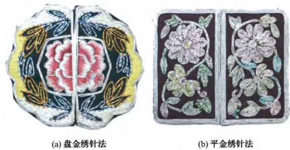
图 2 钉金绣绣片针法

作为中国传统艺术精神和哲学思想的本质体现,虚实相生设计理念贯穿于钉金绣表现形式中,通过“虚”与“实”的设计语言表现,达到视觉上的相互统一与相互衬托,赋予观赏者较大的想象空间和精神享受。