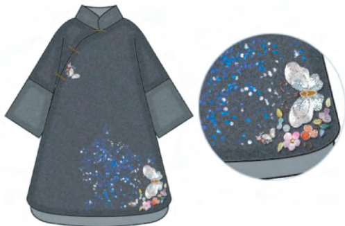
图6 立体化装饰形式毛呢服装

的后现代风格。小面积点缀手法不同于大面积浓重强烈的装饰风格,其在毛呢服装中的装饰,更能凸显钉金绣迹细密工整、肌理变化丰富的特色魅力。如直接装饰于领口、袖口、下摆、门襟等部位,通过刺绣与毛呢面料的质感对比,凸显出钉金绣凹凸有致的装饰效果。立体化装饰形式毛呢服装见图6,结合使用珠片等立体材质进行点缀,搭配线条流动的简约款式设计,不但能够改变单一刺绣的视觉观感和肌理特征,而且使图案层次感更加丰富,衬托出着装者沉静高雅的个性魅力。