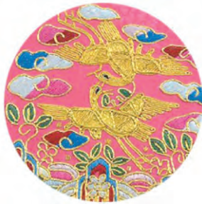
图 1 钉金绣花鸟图案绣片

传统刺绣针法。盘金绣属于条纹绣的一种,是以刺绣图案为依据,将金线盘绕成设计好的图案,再用细线钉在面料上的一种针法,特色明显、装饰性强 [2] ,起到美化与强调的作用,适合表现图案的线条效果,因其线条方向依样盘旋,故称盘金绣。平金绣则以刺绣图案为依据,使用金银线回旋游走,填充绣制出整个图案,与平绣一样都是适合表现图案的平面效果,故称平金绣。钉金绣花鸟图案绣片见图 1,其中的云纹边缘是以盘金绣的针法进行表达,飞鸟纹是使用平金绣针法,利用金色丝线回旋游走刻画飞鸟形态。