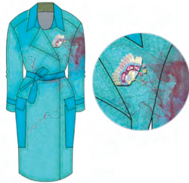
图7 钉金绣花卉图案和传统染整工艺结合毛呢服装

计淋漓尽致的展现出传统工艺的艺术魅力,通过色阶变化丰富、形态具象的钉金绣图案和蓝染水墨干湿、无形的面料肌理产生对比,将毛呢面料幽雅柔和的光泽感表现的淋漓尽致,越发强化出毛呢服装清秀疏雅的典雅之美。既立足于民族传统工艺,又符合当代服装设计的审美意象 [10] 。