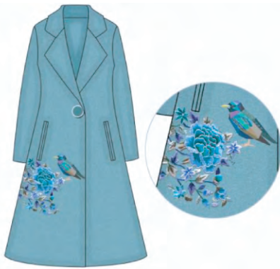
图5 钉金绣花朵图案毛呢服装

的后现代风格。小面积点缀手法不同于大面积浓重强烈的装饰风格,其在毛呢服装中的装饰,更能凸显钉金绣迹细密工整、肌理变化丰富的特色魅力。如直接装饰于领口、袖口、下摆、门襟等部位,通过刺绣与毛呢面料的质感对比,凸显出钉金绣凹凸有致的装饰效果。立体化装饰形式毛呢服装见图6,结合使用珠片等立体材质进行点缀,搭配线条流动的简约款式设计,不但能够改变单一刺绣的视觉观感和肌理特征,而且使图案层次感更加丰富,衬托出着装者沉静高雅的个性魅力。