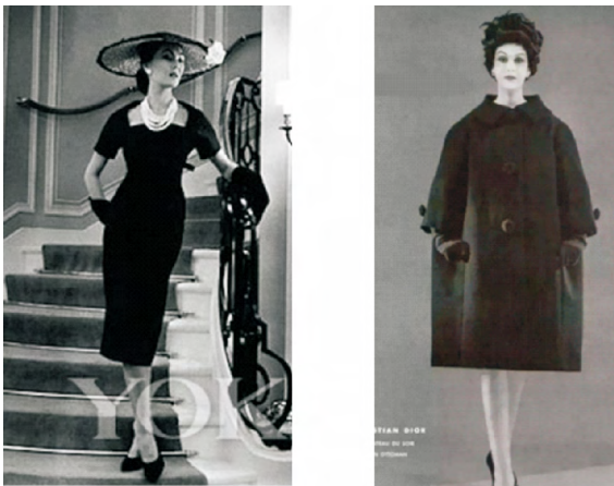
(a) 箭形 (b) 磁石形

这个时期属于 Dior 先生后期创作的一系列廓形线。箭形虽然类似于前一时期“Y line”,属于上宽下窄型,但没有 Y 型那样夸张的肩部设计,显得更简洁利落。无论是磁石形还是纺锤形都已经显现出 Dior 在这个时期所提倡的廓形线概念,与早期的新面貌有极大的反差。这两种廓形几乎看不到女性特征,以极其夸张的外扩型线条设计强调了女性的力量感,很大程度弱化了女性的曲线。但这种廓形也带给女性很大程度上的舒适性和随意性,让女性在穿着时更轻松自如,使女性具有大方、洒脱的特性,且略带立体感。服装整体造型与人体结构形态密不可分,如人体的比例、外形、静态特征和动态特征等 [7] 。该时期也是凸显了人体的舒适性。