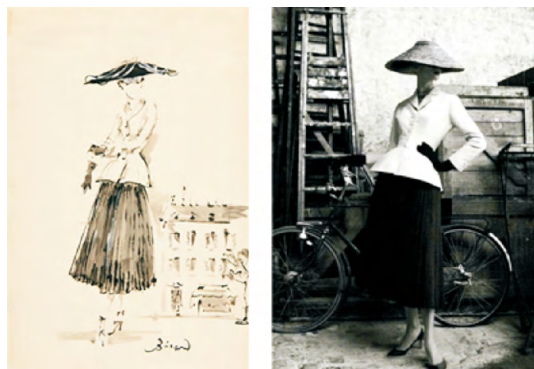
图2 “新面貌”的手稿和成衣

新。数字“8”对于迪奥先生来说意义非同一般,自1947年起,Dior用新颖的曲线设计与难以超越的创新风格推动时装的革命,其灵感来源就是幸运数字“8”。柔和的肩部、如蔓藤般的纤腰、宽大如花冠的裙裾,这是Dior独特线条的诞生,创建了时尚与优雅转折并存的风格,图2中的“新面貌”彻底塑造了女性的新轮廓。所以服装很多时候不仅是一件衣物,更是反映一个时代生活状态、社会变迁,以及自我体现的媒介。