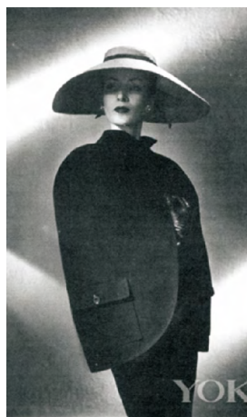
图11 1951年Dior的椭圆廓形 Fig. 11 Dior's Oval line in 1951

1951—1952年,“自然形”“长线条”“波纹曲线形”“椭圆形”和“黑影造型”相继推出 [3] 。1951年的自然形和图11中的椭圆形,体现这个时候Dior开始放松腰部曲线、提高裙子下摆,下半身裙装也不是窄线型的铅笔裙了,整体服装廓形舒适自然了一些。尤其在椭圆形中腰身线条被进一步放松,这一个造型是Dior在酒桶形的基础上创作出来的。图12为1952年的Dior造型中显现出上松下紧的廓形,丰满线条的上衣搭配窄线形裙身使上下的服装廓形对比明显。