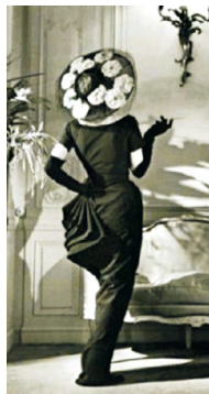
图6 1948年插翅系列 Fig.6 1948's Ailée