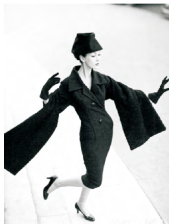
图17 Y line 廓形