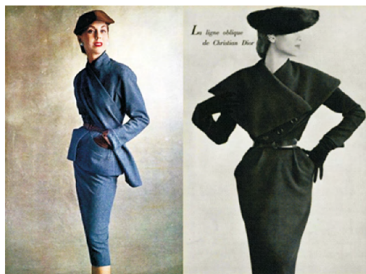
图10 1950“倾斜系列” Fig. 10 1950 “Oblique”

口设计有明显的变化,利用斜襟改变衣服的内部结构造型线。虽然也延续了新面貌的格局,但对领口、袖口和裙身的变化进行了不断尝试。经典的铅笔裙将女性的下半身线条清晰地勾勒出来,通过对肩部和斜门襟的设计来提高服装的创新度。裙身的腰胯部进行了褶皱设计,使得本身紧实的裙身多了一些曲线装饰,增添一丝趣味性。