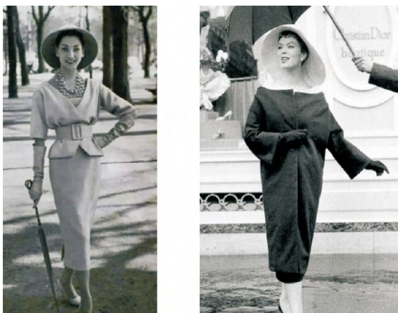
(a) 自由形 (b) 纺锤形