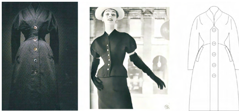
图 13 1953 年的 NEW YORK HC AH Coat “郁金香造型”

紧,下身呈细长形,整体很像郁金香花茎的形状。该造型突出了女性肩部的柔润感,不仅强调肩部到袖臂饱满的线条,同时利用收紧的腰线塑造女性胸部的丰盈,如花瓣般的饱满曲线围绕胸、肩、背、腹部,使上身像充了气似的那样富有立体感和雕塑感。同年秋季,Dior又发布“Tour eiffel line(埃菲尔塔形)”和“Coupole line(圆屋顶形)”。图14(a)为埃菲尔塔形,因其造型类似于埃菲尔铁塔而得名,该裙将裙摆提高到离地面42cm的高度,当时整个服装界一片哗然。褶皱是服装设计中最常用的装饰工艺之一 [4] ,裙摆处利用褶皱装饰使裙身显得较为蓬松而有体积感。图14(b)可以明显感受到椭圆廓形的特点,袖子连肩的设计形成类似于花苞廓形的斗篷,没有明显的袖窿弧线,但在前衣身处设有袖口。门襟处有双颗纽扣设计,扣眼处的带状结构也是连接肩袖部的廓形,继而延续到门襟的设计。衣身廓形在下摆处收口,搭配修身的铅笔裙。整体上身近似于“O”廓形,像一个圆屋顶,因此被称为“圆屋顶形”。