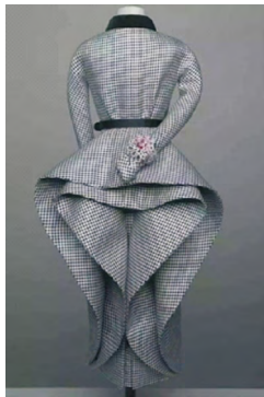
图4 1948年春夏高级订制一款铅笔裙 Fig.4 1948 S/S Haute Couture the design of skirt

女性追求新奇和自由的新感受。另外,图4为1948年Dior推出的春夏经典款cocotte是不对称的层叠裙型,图5为曲折Z系列的caprice裙表现出一些新的服装造型线,裙身的内轮廓线出现了丰富的层次感。图6的插翅系列非常注重腰臀部的线条造型感,利用多层折叠工艺丰富臀部造型,强调女性新形势下的审美追求。图7为Dior在1949年推出“Trompe l'oeil”款式,这个词在法语里面是“欺骗眼睛”,是在1948年后“8”字廓形女装热潮逐渐冷却后出现的“Paneled skirt(多片裙)”,通过在贴身裙外增加了一块或多块的装饰面料即罩裙,使下半裙身具有更洒脱的变化。