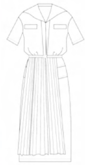
图7 1949年推出的“Trompe l'oeil” Fig.7 “Trompe l'oeil” launched in 1949

该时期较为著名的就是1949年Dior先生亲自为他宠爱的妹妹设计了一件全身充满刺绣的抹胸礼服——Miss Dior [2] (图8)。相对于1948年的插翅系列,这款署名Miss Dior的礼服在其造型线上要简单得多,但在面料再造上却体现出了Dior工匠们的非凡技艺。白色透明的全丝硬缎上用平纹细布丝带绣出大小不一的花朵图案,每一朵小花都是手工刻模制作而成,再将一朵朵小花缝制到硬丝上形成栩栩如生的花丛。礼服腰部装饰着一条绣花丝带,裙身上手工制作的玫瑰花和铃兰花精美细致,呈现出半立体视觉效果,为这件礼服增添了很大的艺术价值。实际上这些传统的手工艺至今仍影响着Dior品牌的设计,每年的高级时装定制秀场上总能看到这些能工巧匠的作品,不时地给秀场带来惊喜。