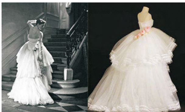
图9 1950年春夏高级时装定制“垂直系列” ——“舒曼”舞会礼服

1950年出现了“垂直造型”和“倾斜造型”。Dior虽然每年都会推出一些新的造型线,但基本上延续了“新面貌”的廓形特点:自然柔和的肩线、纤细的腰身。衣身细节处进行了变化,如领口、袖型、裙摆等。图9为“舒曼”白色真丝薄纱镶瓦朗斯花边舞会礼服的后腰饰以连续下坠的“迪奥玫瑰”,这是1950年春夏高级时装定制“垂直系列”。在垂直系列中,不难看出依然有“新面貌”的影子,其造型线还是延续着经典的细腰丰臀,只不过腰线位置稍加提高,体现出下半身的修长线条,并对裙子造型进行了夸张和层叠设计,增加其丰盈程度。图10中的“倾斜造型”领