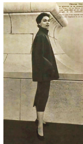
图12 1952年的Dior套装 Fig. 12 Dior's Suit in 1952