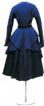
图5 1948年春夏Z系列caprice裙 Fig.5 1948 S/S Z caprice skirt