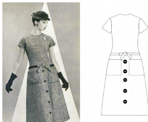
图16 A line 廓形

直到1955年Dior发布了一个影响至今的造型“A line”和“Y line”(图16、图17),这两种造型线在现代服装中也被频繁使用。A廓形线让服装具有活泼、潇洒、流动感强、富于活力的特点 [5] 。图16中A形裙使模特看上去娇俏而年轻,腰间的蝴蝶结设计也是Dior非常喜爱的元素之一。A廓形线不同于新面貌时期的8造型线,它收窄肩部线条,不用垫肩,放开腰线,拓宽衣身或裙身线条。Y廓形线的特点是肩部造型夸张,收紧下半身线条,着重突出上半身,整体服装廓形是上宽下窄,使服装表现出力度但不失女性柔美的线条感。