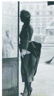
图3 1948年春夏高定的飞行系列

1948年继“新风貌”之后,曲折(Zig-Zag)、飞行(Envol)、插翅(Ailée)系列应运而生 [2] 。这些系列运用大胆简洁的服装廓形不仅赋予女人更时尚的优雅,也让女人的穿着显得更年轻、洒脱。图3为1948年飞行(Envol)系列,通过裱衬工艺达到服装的廓形效果,使其完全不同于传统的服装造型线。例如在裙装中垫高了臀部,以夸张的后部裙身线条增强立体感和流线感,扩大整体穿着的自由度,并塑造出新