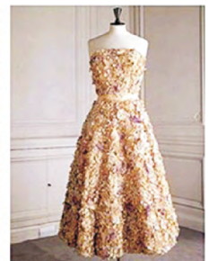
图8 1949年的满身刺绣礼服——Miss Dior Fig.8 Miss Dior, Embroidered dress in 1949

与最初的新面貌相比,曲折系列中带有Z字形线条的裙子轮廓使简洁的裙身更加多变,线条更流畅,但依然保留着“新风貌”时期采用立体裁剪中玛德丽·维奥内女士首创的斜裁技艺,为所有高支细棉布和塔夫绸面料系数添加衬里,以彰显其考究感与庄重感 [2] 。相对于飞行系列,Z系列和插翅系列更加注重腰臀部的造型线变化,在常规的裙身上增加层叠、折线效果,使臀部线条看上去丰富而有趣。但