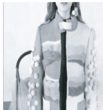
图 7 羊毛线性排列空间

为了能够表现出不同的解构意味,采用羊毛经扭拧工艺形成的线性排列空间,见图 7,以及羊毛的纵向拆分即色彩反差的拼接图案体现出解构意味,主要是通过将羊毛面料经过扭、拧的手工处理,于无序中见有序地以纵向排列组成对襟的 4 个小方块,缝制于羊毛毡成衣上。该系列设计女装还综合了经解构所形成的羊毛毡拼接图案,见图 8,其表达出解构意味在上衣下裳中的体现。