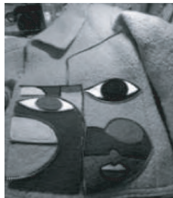
图 6 解构的人的面部

和鼻子部分,解构的人的面部见图 6。在齿链与齿链之间又以不同的缝合线,表现出经解构手法拆分后的人的面部情绪特征,抽象但富有意味。