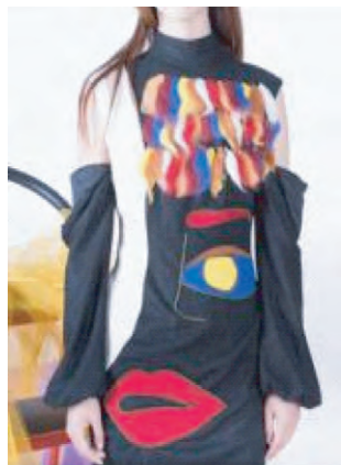
图10 羊毛毡设计的女装