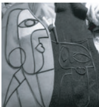
图8 羊毛毡拼接图案

一座房子存在不止一种方法 [6] 。同理,解构意味不止体现于服装式样上的设计与制作,还通过弱化了的色彩平衡性的强烈对比 [7] ,面料色泽以夸张 [8] 打破了色彩美感的形式法则在服装设计中的应用,使之与其色相、纯度和明度的谐调形成了鲜明且浓厚的对比。色相、纯度与明度构成了色彩的3要素,色相在色相环中体现,如图9所示,色相环角度可以显现出色彩的相似、对比、反差或互补;纯度是指用色时色彩的比重,比重越大、颜色越浓,比重越小、颜色越淡;明度则是对色彩明暗的概括,三者既各为独立,又相互辅助。