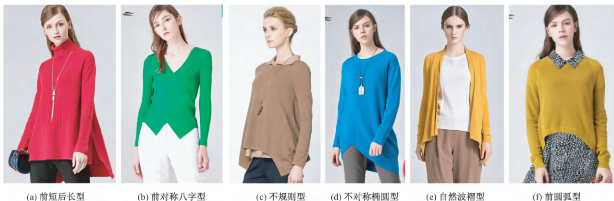
图 3 歌力思产品下摆设计