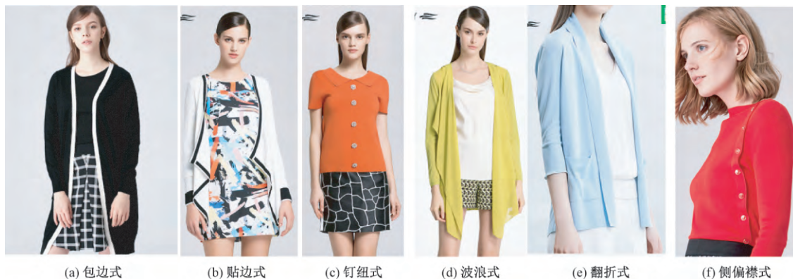
图2 歌力思毛衫多变的门襟设计

毛衫除外形设计之外,还要对局部进行设计,毛衫的局部设计主要体现在领、袖、门襟、下摆等部位 [5] 。南北品牌毛衫局部设计的差异性主要体现在门襟、领型、长短与下摆型。