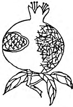
图4 小乱针针法示意图

论是精纺毛呢还是粗纺毛呢,都可与不同的乱针针法完美融合,即使没有具体的图形和色彩做对比,通过长短粗细交错排列、乱而有序的线条,亦可改变毛呢面料的维度,增加毛呢面料表面的层次感,即可形成毛呢面料表面肌理的二次再造。服装材质的层次感设计已成为当下及今后若干年中服装流行的焦点要素 [10] 。国际时装舞台上乱针绣肌理时装见图5。