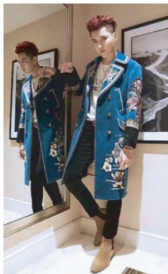
图2 歌手吴亦凡身穿刺绣大衣

绣与其他绣种最大的区别在于线条组织结构的不同。其他绣种的线条组织多为1针1线整齐排列或衔接,乱针绣线条的交叉特性,使其具有独特的肌理美。宝应乱针绣的交叉形式大致可分为2类。