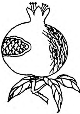
图3 大乱针针法示意图