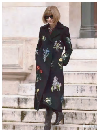
图1 美国版《VOGUE》杂志主编身穿刺绣大衣

肌理是物体表面的组织纹理结构,如各种纵横交错、粗糙平滑的纹理变化。在美学领域中,肌理指由材料的不同配列、组成而使人产生不同的触觉质感和视觉质感 [7] 。服装肌理中的“肌”是指服装面料的材质,而“理”则是指服装面料的造型,包括面料的线型、织物的组织结构、整理工艺等 [8] 。乱针