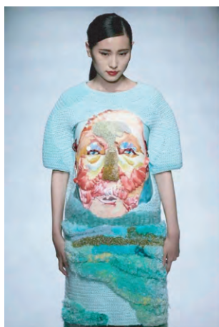
图6 乱针绣与多种装饰工艺结合