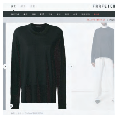
图1 The Row品牌针织上衣

美国高级时装品牌The Row由Olsen姐妹创立,这个年轻品牌的特别之处是只售卖基本款时装。The Row品牌针织上衣见图1。宽松针织毛衣含税售价约11 125元人民币,材质为美丽诺羊毛/桑蚕丝/羊绒混纺,在意大利制作。