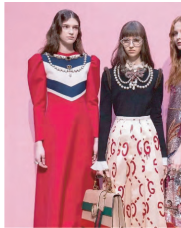
图3 古驰时装的“双G”涂鸦元素

因此,高级时装品牌需要在化解危机、追求速度的同时,牢牢抓住年轻消费者的心理。在网络时代,高级时装品牌的危机处理不仅需要敏捷的反应速度,更需要化危机为机遇的智慧。