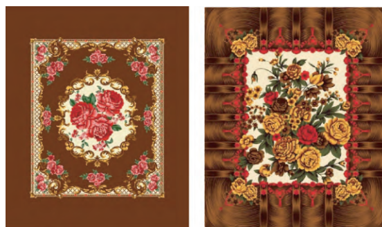
(a) 中东市场经典款 (b) 中东市场畅销款

北非地区在地理位置上靠近欧洲,受到欧洲美学思潮的导向调和,且深受阿拉伯文化的熏陶。因