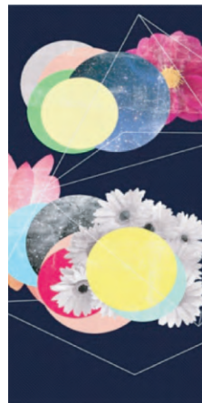
图5 与摄影拼贴风格融合

受并运用,如今这二者拓宽了其表现空间,形成了新的摄影与拼贴风格,对毛毯的花型设计具有别具一格的指导意义。在2018年家纺流行趋势中,摄影与拼贴风格已经成为独树一帜的创新艺术风格 [6] 。与摄影拼贴风格融合见图5,是将经过Photoshop处理后的月球影像与花卉摄影进行拼贴组合,不同颜色的圆形起到过渡与丰富画面的作用,线条穿插后使平面有了空间感,新颖别致。