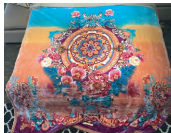
图6 与油画风格融合的拉舍尔毛毯

将以构图新颖、形式优美、具有浓厚的装饰韵味的威尼斯画派艺术、以重视形式的统一与调和的古典主义画派与画面富有运动感的浪漫主义画派等绘画艺术风格融入于毛毯的花型图案设计中,毛毯产品所展现出的将不仅仅是图案的美感,还有浓厚的艺术气息,可为家居环境增添一份文化底蕴 [7] ,也体现出绘画艺术对家纺设计的深入影响,使得纺织品本身不仅具有了实用价值,更体现出一种人文精神和美学文化。与油画风格融合拉舍尔毛毯见图6。油画风格花卉簇拥手绘星盘,古典主义画框在毯面底部衬托佩兹利纹,具有很高的装饰意味。