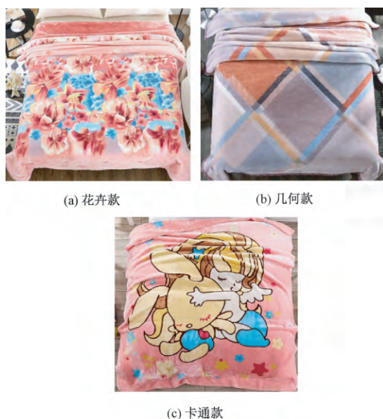
图3 我国北方地区拉舍尔毛毯常见款式