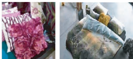
(a) 立体花卉在家纺产品中的应用

可以低成本高效率地生产出具有高质量的3D打印纺织品 [10] 。与3D立体工艺的结合,让毛毯具有更为现代与创新的独特魅力。图9(a)是立体花卉在家纺产品中的应用。与3D打印工艺结合,画面整体呈现出的逼真效果能为家居环境带来勃勃生机(图9(b))。虽然目前受到印染成本、工艺水平等限制,但这仍是未来家纺趋势的发展方向,3D效果的自然风景图案能够让回到家中的人们舒缓压力,放松心情。