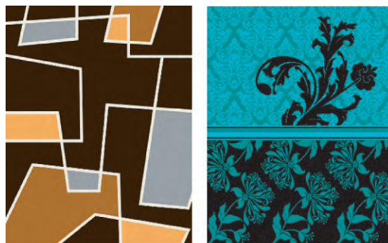
(a) 几何款 (b) 畅销款

此在出口北非市场的拉舍尔毛毯产品中,几何纹样、动物皮草纹样、宗教风格纹样是常见的花型纹样。整体花型的组合形式一般有3种,第1种是动物皮草纹样为底纹,花为主体,起到稳定与支撑画面的作用;第2种是几何纹样以连续的组合形式呈现,中间配置花卉纹样;第3种是通过不同颜色及大小的纯色色块经过前后排列组合,营造出空间的纵深感。北非市场拉舍尔毛毯的常规配色有黑红配色、黑棕配色、黑紫配色、黑配蓝绿等。北非市场拉舍尔毛毯典型花型见图2。