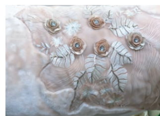
图8 与刺绣工艺结合

在毛毯绒面经过凹凸工艺形成立体效果的基础上,将刺绣工艺运用于绒面上,在材质的表现上有了鲜明的对比。首先,确定绒面形成凹凸花纹的位置与形状,其关系到整体的布局。需要形成凹凸花纹部位的形状可以根据整体的设计风格进行选择,可以是叶形、花形等元素。在细腻的网纱面料上通过机绣缝纫出形态柔美的叶子,叶子的脉络则是由串珠工艺制作而成,显得精致醒目。通过精巧的工艺手法,绣线由点成面丰富了画面,织带旋转缠绕形成了一朵朵精美的花,点线面的完美结合,平面与立体相互映衬,具有极强的装饰效果。与刺绣工艺结合见图8。