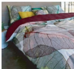
图4 与自然主义风格融合拉舍尔毛毯

自然主义风格追求去繁取简,纹样偏向于简洁精致,但是简洁而不简单,简中有繁,纹样的细节刻画更为细腻,层次更为丰富。而北非市场钟爱的花型风格一般以简洁、概括的形式出现,与自然主义风格的设计趋势十分切合。自然主义风格以大胆抽象的手法突破简单的模仿,在针对北非市场的花型设计中,可以与此风格相互融合,在简约的廓形中加入自然界中的水纹、花卉、树木等元素的肌理纹样,形成虚实有致的新纹样 [4] 。与自然主义风格融合拉舍尔毛毯见图4。