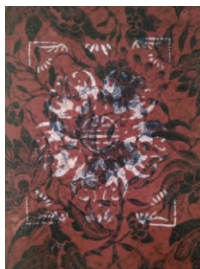
图6 双色叠加图案效果

选取本身带有蓝色豆荚花图案的棉布,结合已有图案,在其基础上设计出叠加图案,再刮涂防染浆,浸染红色,即可呈现出若隐若现的双层图案颜色的叠加效果,见图6。改良方法后的印花面料,可改变传统沙河豆面印花的单色、单层图案效果,使面料图案、色彩更为丰富。试验时需注意底层图案与上层图案的主次搭配,避免出现杂乱感。