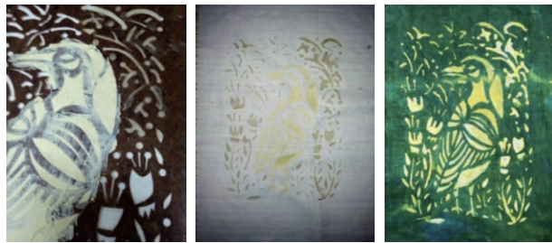
图7 与蜡染相结合的多色印染

蜡的部分变为绿色,中间鸟的部分染为黄色。最后一步将蜡煮掉,这样就形成了一块三色的印花面料,见图7。